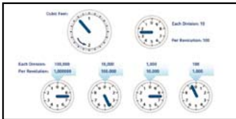
An léamh ón méadair seo ná 7479

Mar atá sa phictiúr, bíonn áiritheoir diaileanna ann, agus cibé más méadar ceithre dhiail nó cúig dhiail atá agat, beidh ort nóta a ghlacadh de na huimhreacha atá le feiceáil ar na diaileanna dubha, chomh maith le bheith ag léamh ón taobh clé agus an uimhir ar an diail dhearg a fhágáil amach as an áireamh.